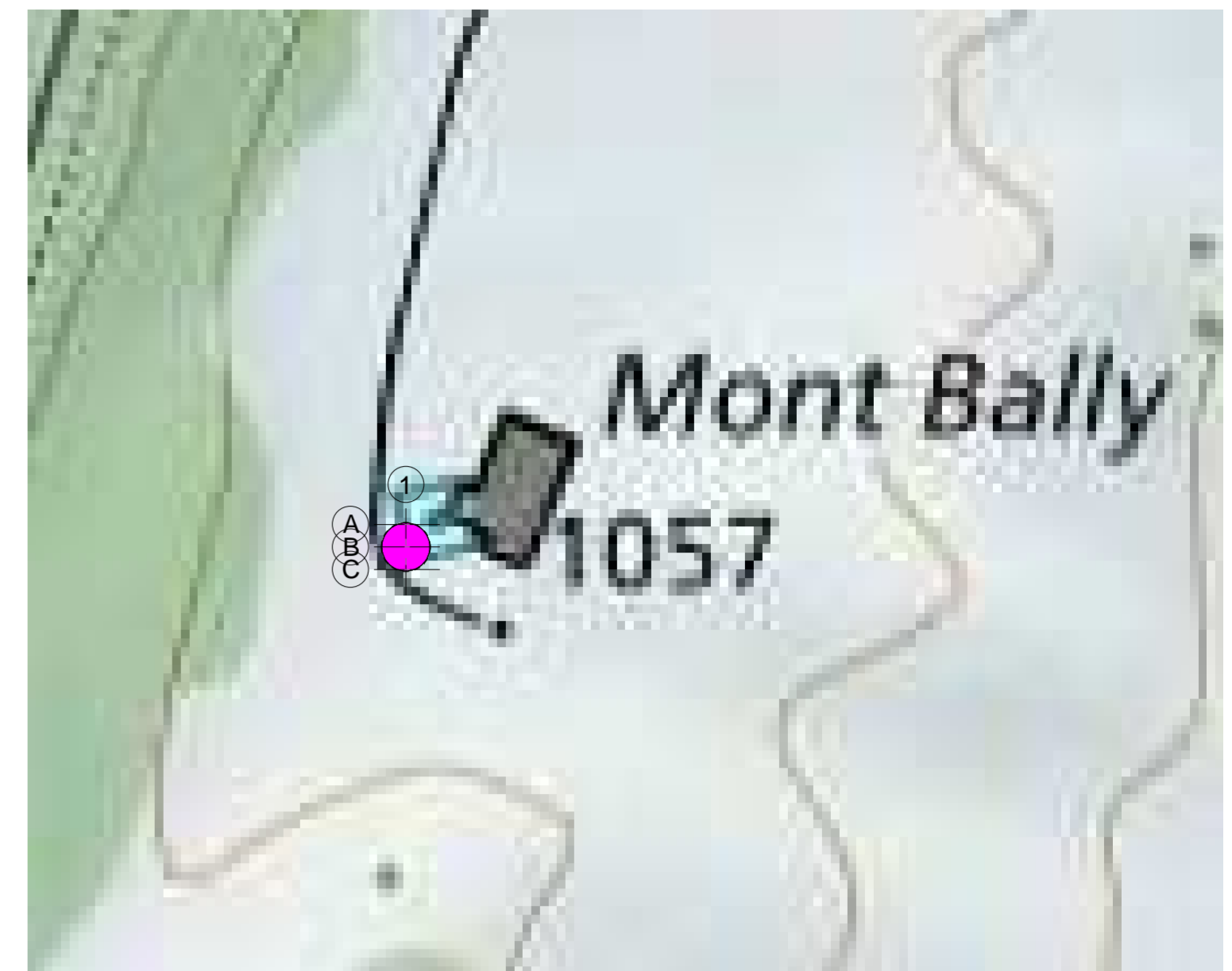
Courbes de niveau EG M 1 : 1000