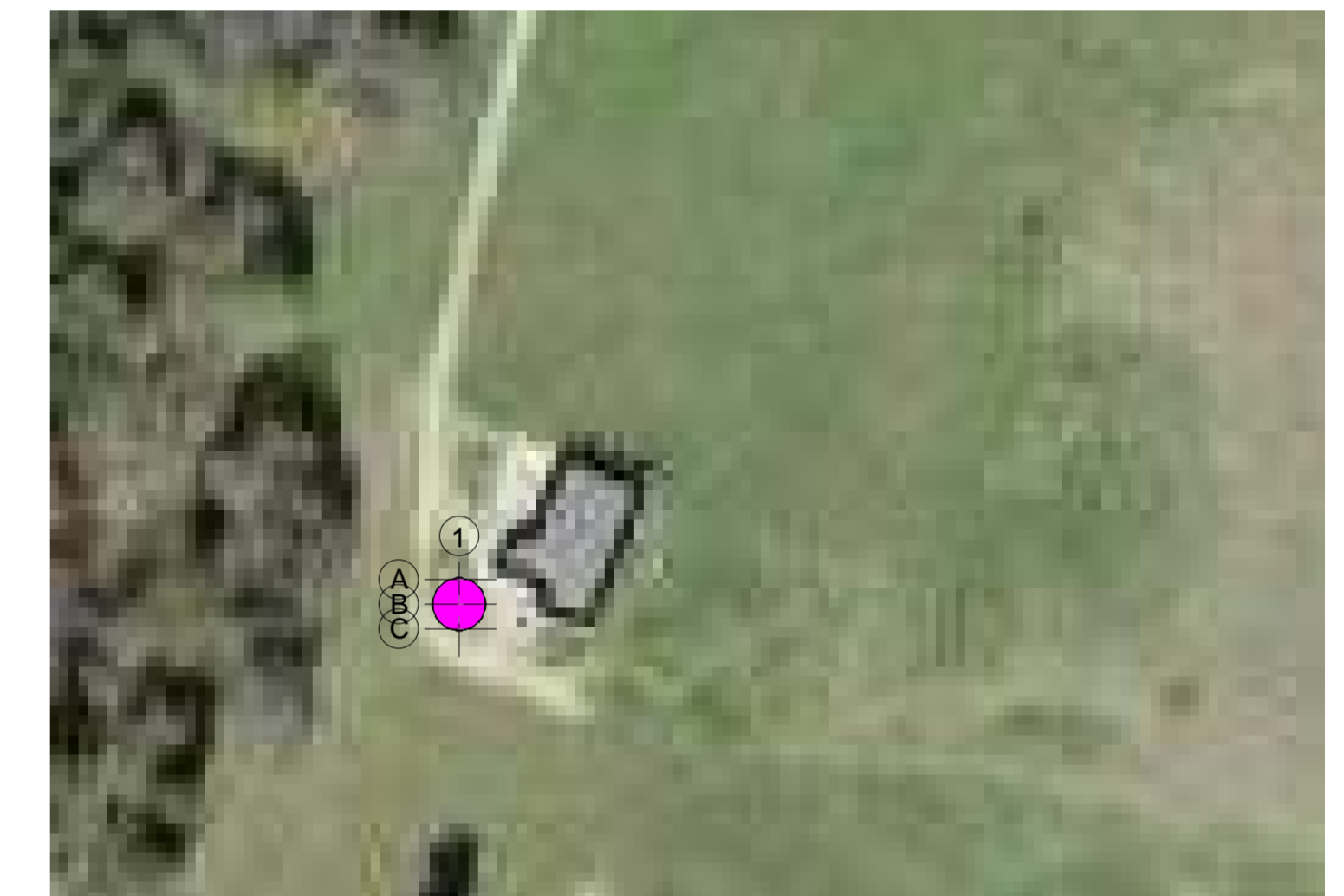
Orthophoto EG M 1 : 1000