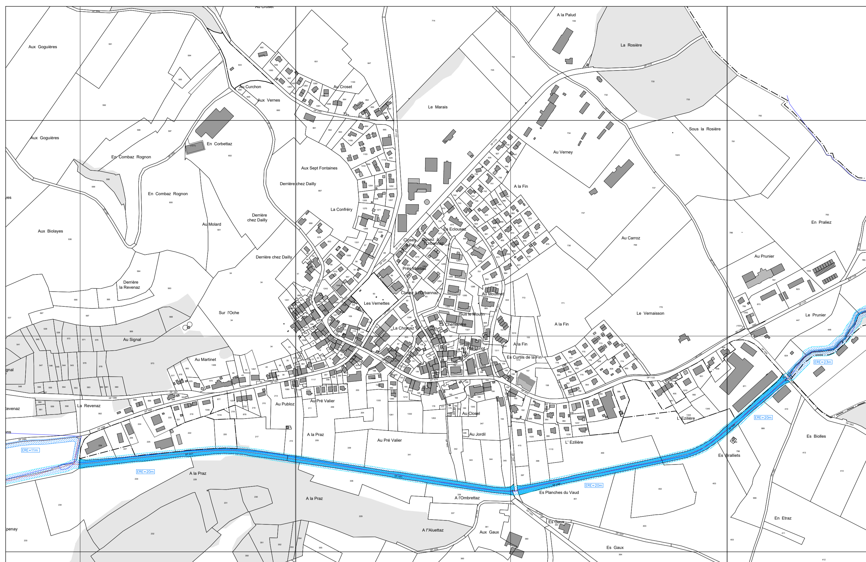
PLAN DE L'ESPACE RESERVE AUX EAUX (ERE) - 1:10'000

ESPACE RESERVE AUX EAUX Espace réservé aux eaux (ERE) selon OEAux art. 41a et c ERE<XXm> Largeur de l'espace réservé aux eaux Axe du cours d'eau de base Axe du cours d'eau corrigé Etendues d'eau de base