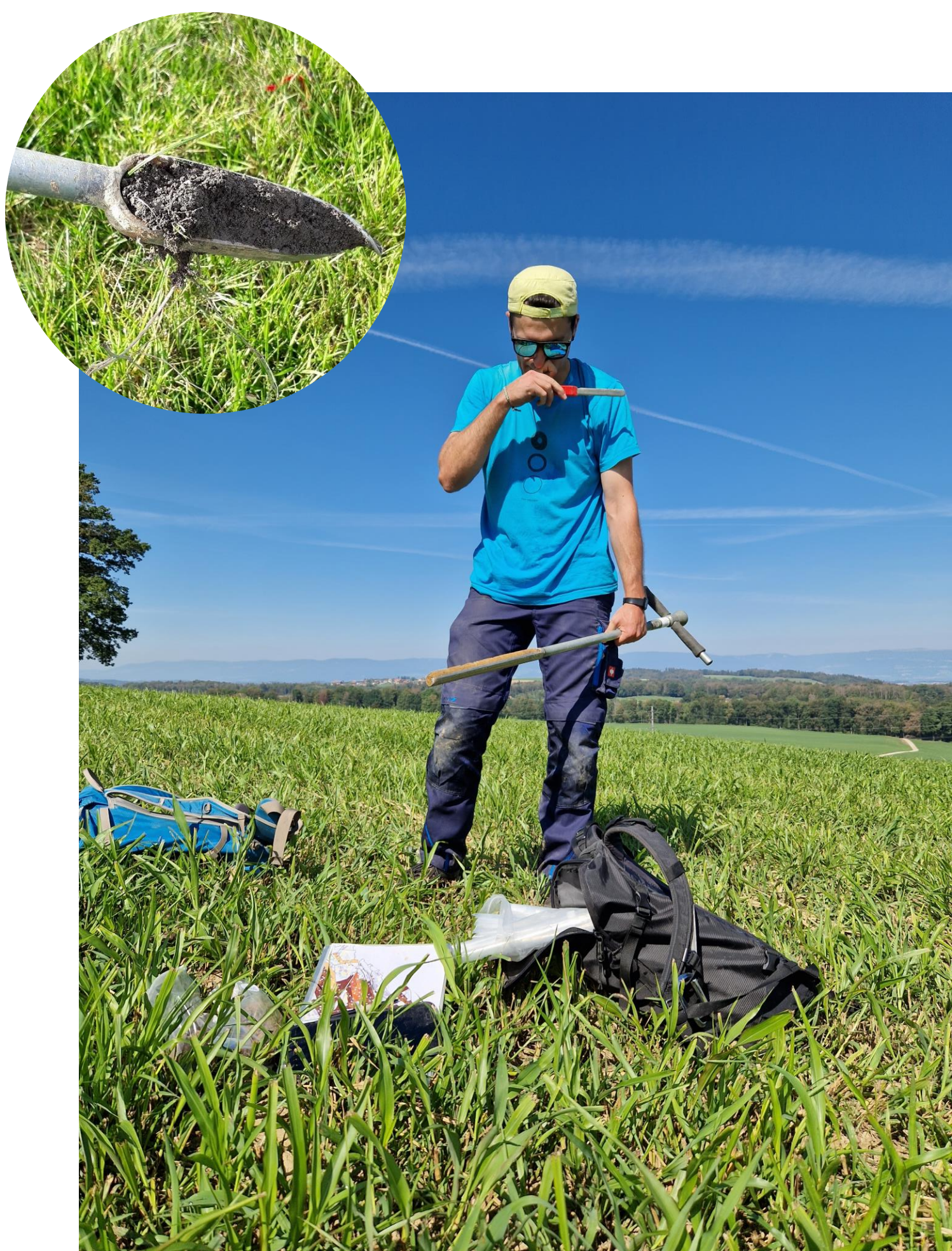
Investigation avec une tarière (sondage)

Le projet se déroulera jusqu'à fin 2025. Les pédologues (spécialistes des sols) réalisent des sondages à la tarière à la main, sans impacts sur les cultures. Une quarantaine de profils de sols seront creusés à l'aide d'une pelle mécanique, en tenant compte des cultures en place ou à venir. Les propriétaires et exploitants concernés seront informés.