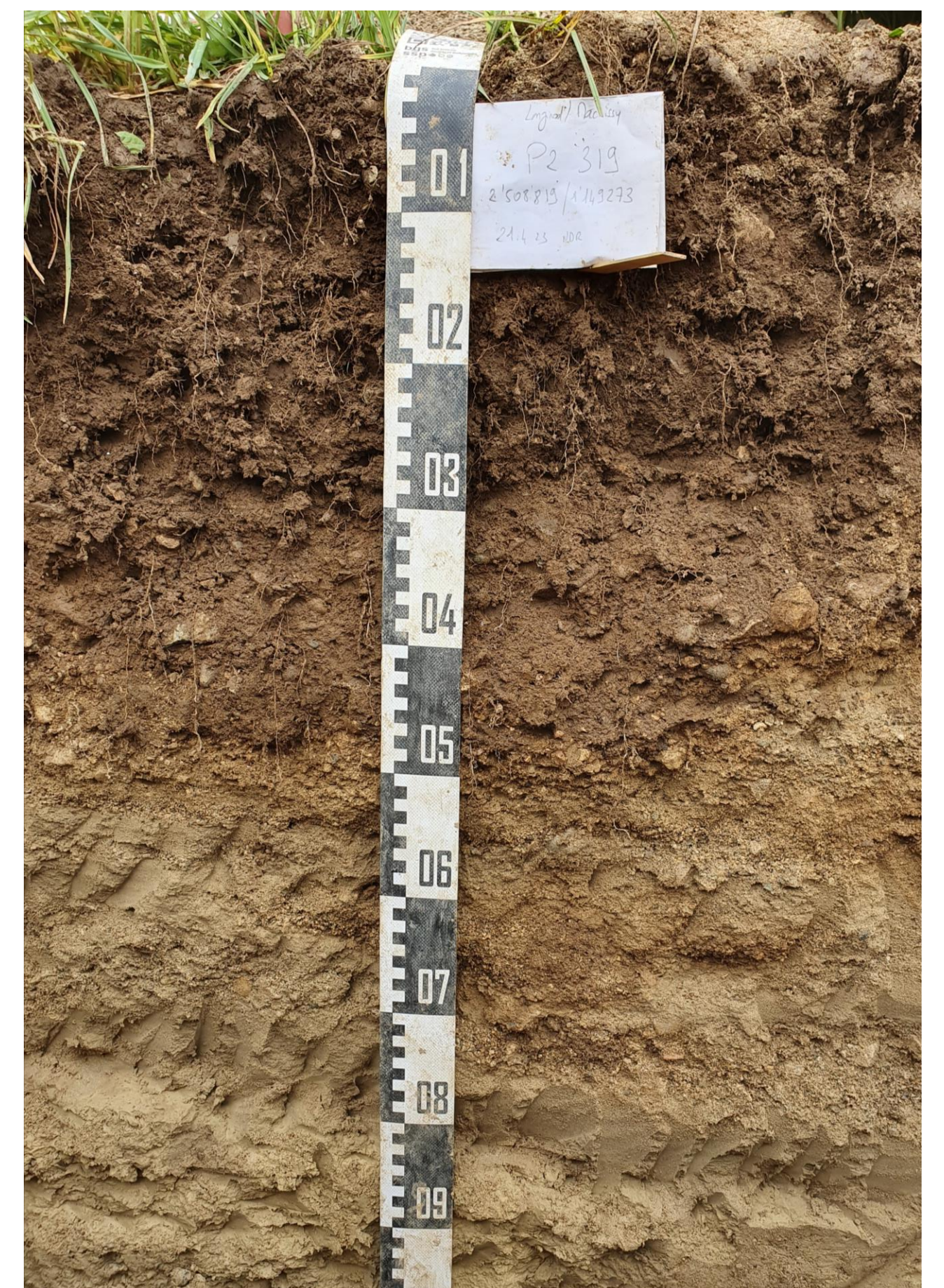
Profil d'un sol